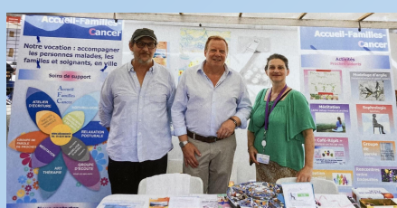
Saint Maur des Fossés