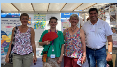
Journées des associations: