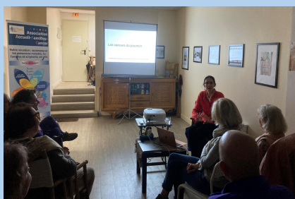
Table ronde cancers du poumon