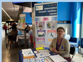
AFCancer à Henri Mondor pour Mars Bleu 26 mars 2026