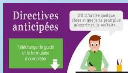
Directives anticipées Samedi 17 janvier