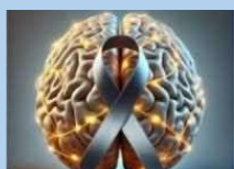
Cancers du cerveau 17 février