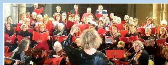
Concert Dimanche 12 avril 2026