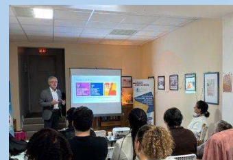
Cancers colorectaux 31 mars